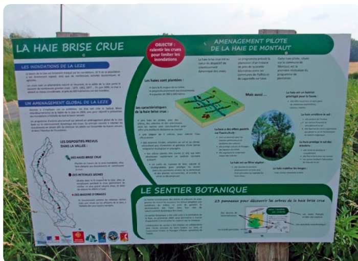
Sentier botanique pédagogique - crédit photo FNE Midi-Pyrénées ©

Aujourd'hui, l'idée que la prévention des inondations passe par le maintien des haies dans les parcelles commence à intéresser d'autres collectivités : d'autres PAPI réfléchissent à favoriser la plantation de haies « brise crue » et de haies de versants, concrétisant ainsi le concept de ralentissement dynamique des crues.